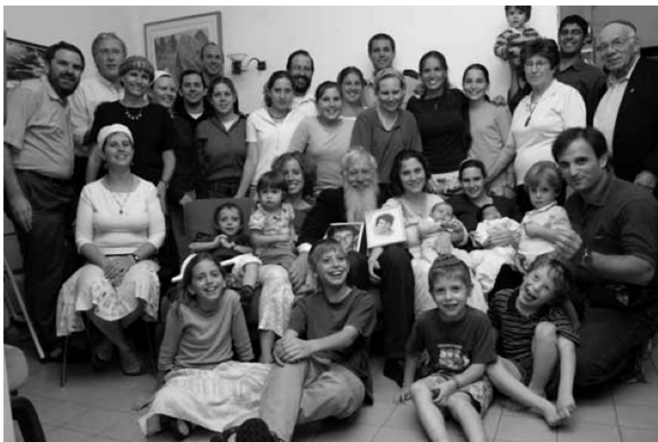
Fig. 2. – Bob Aumann con i suoi parenti stretti, Gerusalemme, 10 ottobre 2005.

operativa a Princeton. Questa era una svolta piuttosto radicale perché la topologia algebrica è all'estremo della matematica pura e la ricerca operativa è molto applicata. Eravamo un piccolo gruppo di circa dieci persone al Forrestal Research Center , che è affiliato all'Università di Princeton.