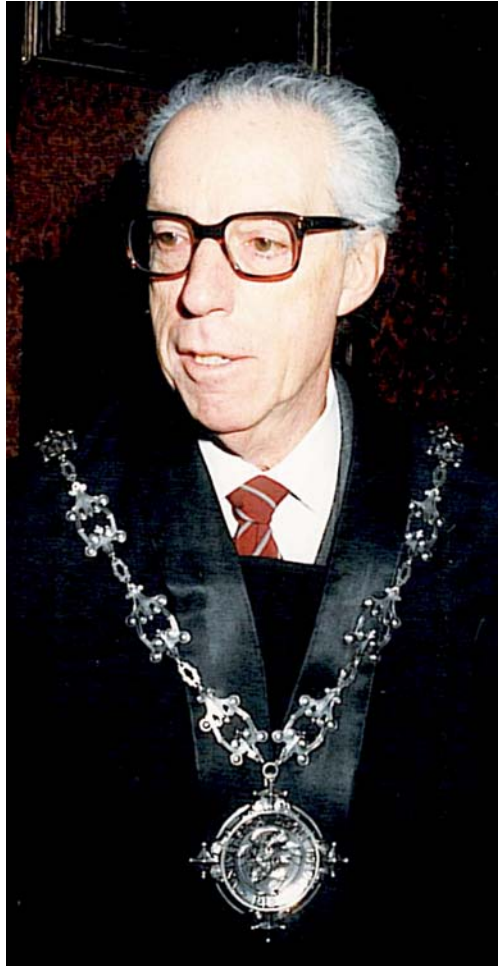
Fig. 2. – Tristano Manacorda, in occasione del conferimento dell'Ordine del Cherubino dell'Università di Pisa.

“energia superficiale”. Questa idea è anche contenuta in un celebre lavoro di Dunn e Serrin del '85, dove gli autori motivano la presenza dell'extra flusso già considerato da Manacorda, come un nuovo effetto dovuto al lavoro che si genera sulle interfacce da loro chiamato interstitial work .